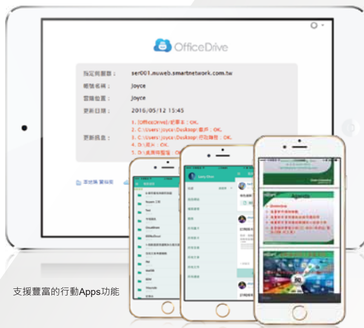
支援豐富的行動Apps功能