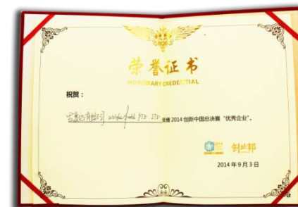
中國創業邦優勝平台