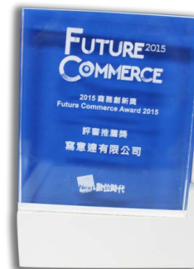
數位時代最佳創新平台