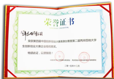
廈門新創創新一等獎