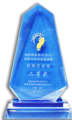
兩岸新創創新優勝