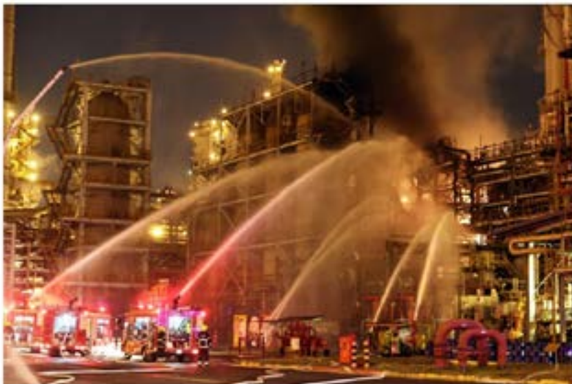
中油大林廠第三重油製罐工場27日深夜發生火警。