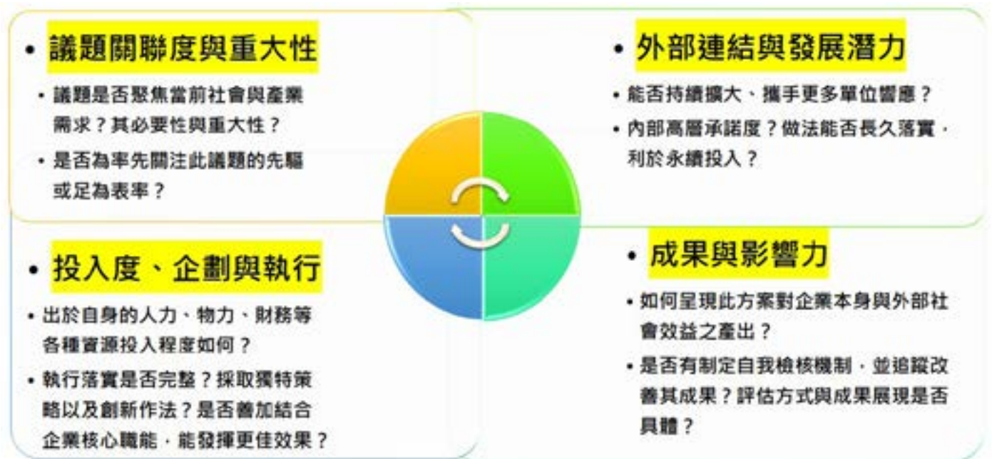
圖 6-4-2 遠見傑出方案獎的評選重點